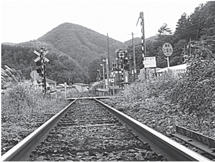
走ってつなぐ、木次線三井野原駅付近

教育環境の充実に向けた人材確保。九つ目が、国スポに向けた人材確保。10項目めとして、出雲空港の利便性向上、FDA名古屋便の継続運行。その他町内の道路河川整備促進、農村地域の防災や農業基盤整備の促進、治山事業の推進について要望を行った。