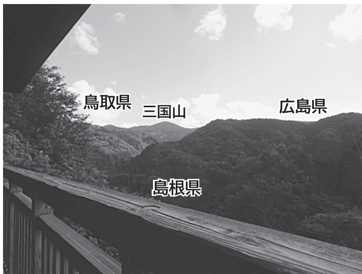
森林資源を蓄えた島根・広島・鳥取をまたぐ三国山